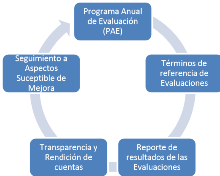
Ciclo de la Evaluación del Desempeño

Nota: Información oficial de la Secretaría de Hacienda y Crédito Público para todas las instancias gubernamentales de cualquier ámbito deba cumplir (2011).